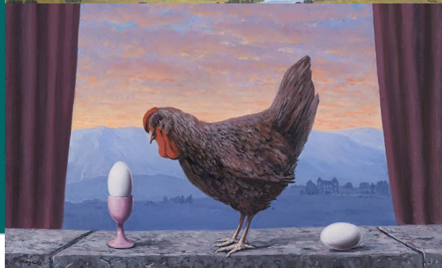
René François Ghislain Magritte